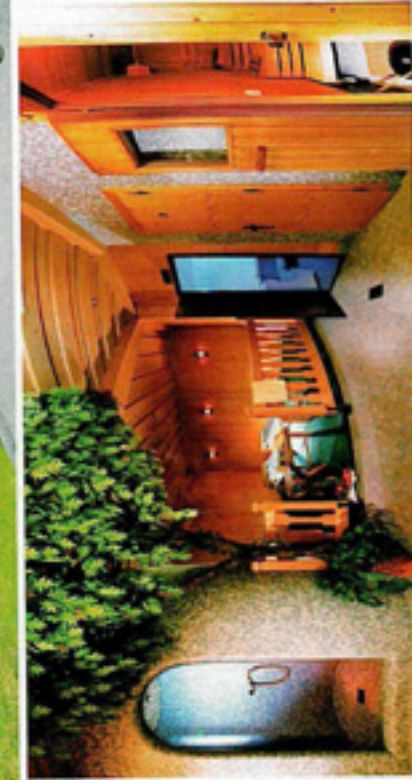
Perfekte Mischung aus Action, Wellness, Genuss und Erholung Hinterzuckerhof (Bild oben u. Bild links).