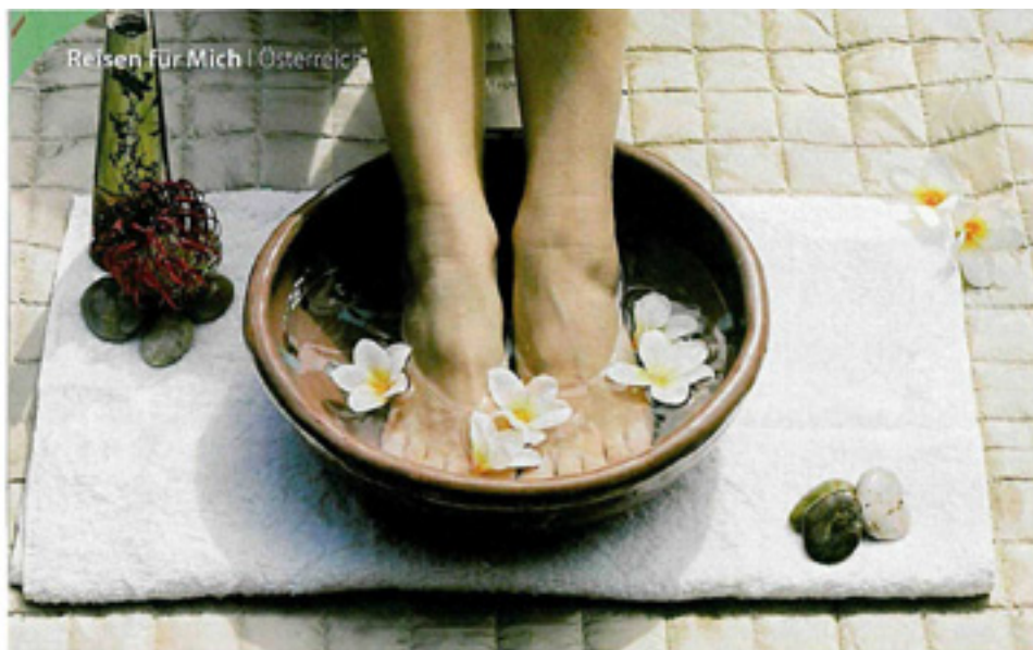
Ein paar chillige Stunden mit den Füßen im Kräuterwasser (Foto links) können „Wunder“ bewirken. Ist sehr gesund und belebend für Geist und Körper.