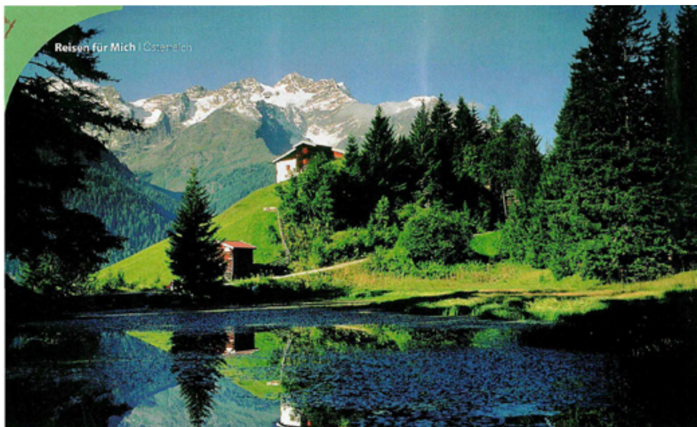
Reisen für Mich | Österreich