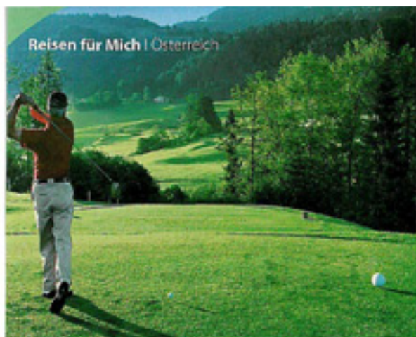
Reisen für Mich | Österreich

Pärchen haben es in Österreich besonders schön. Die Natur hier bietet viel Raum für die Romantik. Aber auch für gemeinsame Aktivitäten wie zum Beispiel den Golfsport (li. im Bild: Golfanlage „Das Schiff“-Hotel, re. im Bild: das Hotel „Das Schiff“).