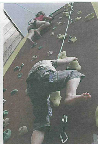
◆ Egal, ob Urlaub oder Tagesausflug: Der Waldheimathof bietet ab Sonntag, den 21. Juni, Abenteuer und Spaß für die ganze Familie WALDHEIMATHOF