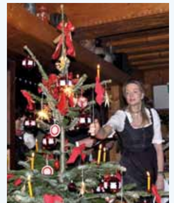
Weihnachten bei Fam. Bruggraber