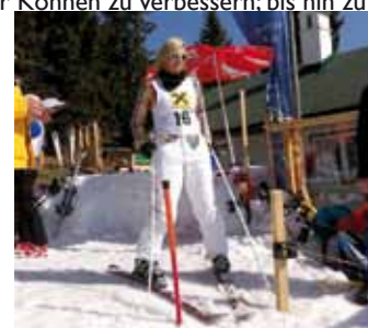
Firmen- & Vereinskirennen

Info Skischule 0664 / 25 24 758 • skischule-alpl.at