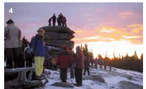
1 - 5 vom Monduntergang bis Sonnenaufgang