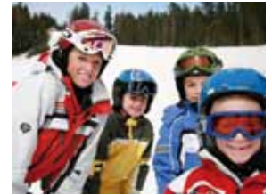
Direkter Liftestieg vom Waldheimathof